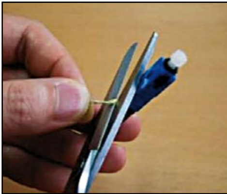
10. Corte las fibras sobrantes