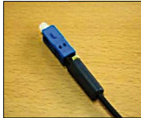
11. Montaje Terminado