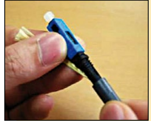
9. Cierre la bota con las fibras