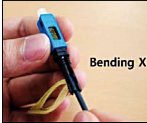
8. Libere el doblar de la fibra