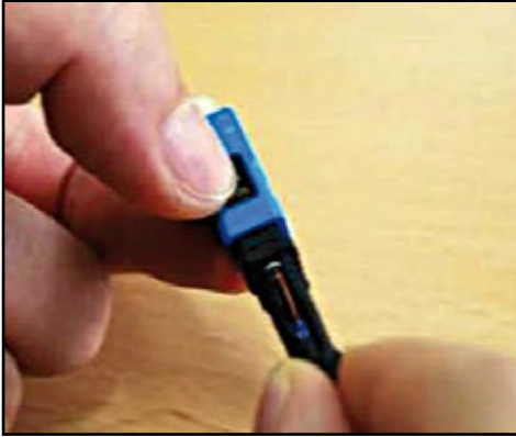
7. Presione el botón (cubierta amarilla)